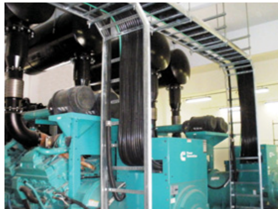
Na imagem à esquerda, é possível observar um dos Grupos Geradores Cummins modelo C2000 D6. Na sequência, detalhes da instalação.