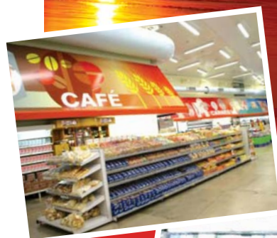
A paisagem da cidade e imagens do Big Lar